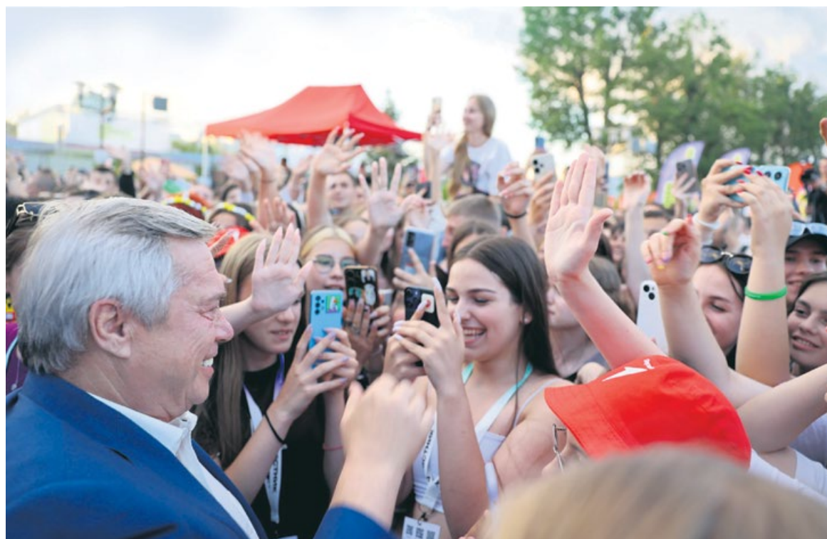
Глава региона уверен, что молодежь Дона – главное богатство области

– В этом году планируется открытие обновленного центра в Шахтах. Всего в городах и районах Дона работают более 180 молодежных центров, включая добровольческие и патриотичес-