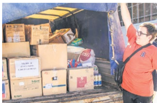
Сбор гуманитарной помощи для жителей курского приграничья, вынужденных покинуть свои дома из-за обстрелов ВСУ, продолжается. Каждый житель города может принести товары первой необходимости в пункт приема в ДК «Октябрь» (кабинет №8) с 14.00 до 20.00 или в общественные приемные депутатов Волгодонской городской Думы.