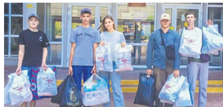
Студенты, преподаватели и сотрудники института и техникума ВИТИ НИЯУ МИФИ приняли участие в сборе гуманитарной помощи для жителей приграничных районов Курской и Белгородской областей.

Первая партия гуманитарной помощи уже собрана и отправлена в городской пункт сбора – в ДК «Октябрь». Сбор продолжается.