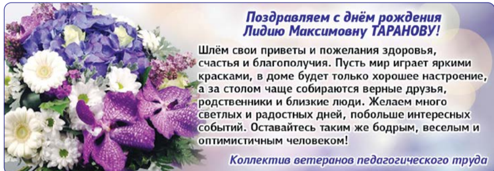
Ветераны педагогического труда

Поздравляем и желаем крепкого здоровья, тепла и заботы близких людей. Пусть и голос, и творчество продолжают радовать всех, любой прожитый день будет наполнен улыбками и счастьем, а каждый новый год жизни приносит только радость и исполняет самые сокровенные желания!