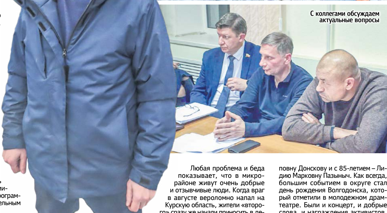
С коллегами обсуждаем актуальные вопросы

тели. В округе № 2 провели большой субботник по уборке улицы Ленина от площади Победы до площади Гагарина. Вместе с горожанами трудился и депутат.