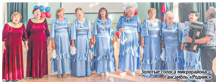
Золотые голоса микрорайона – ансамбль «Родник»