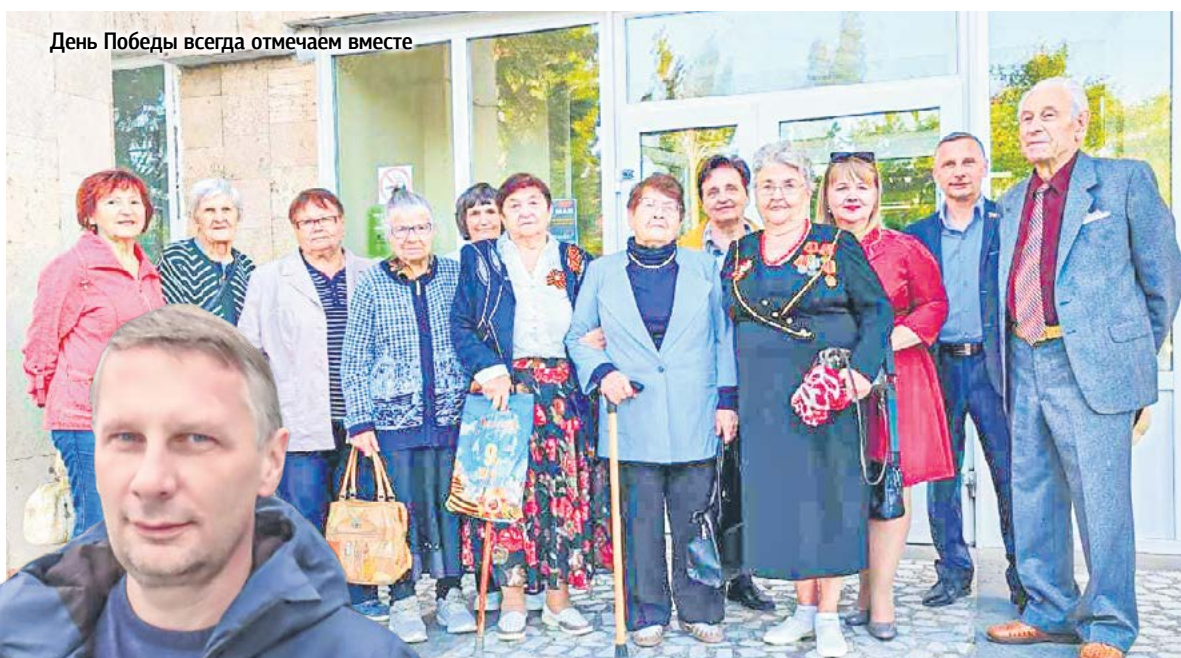
День Победы всегда отмечаем вместе

Порядок в микрорайоне всегда был и остается важнейшим пунктом депутатской работы. Настоящим испытанием для округа, как и для всего города, стал февральский циклон «Ольга». Улицы оказались завалены ветками, которые сломались под тяжестью ледяного дождя. Понимая, что коммунальщики не справляются с проблемами, во дворы вышли жи-