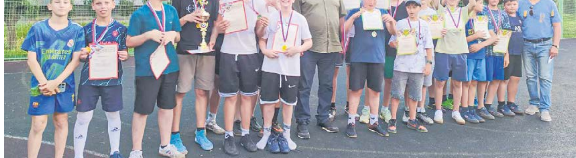
Материал подготовила Екатерина АЛЕКСАНДРОВА