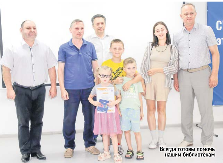
Всегда готовы помочь нашим библиотекам