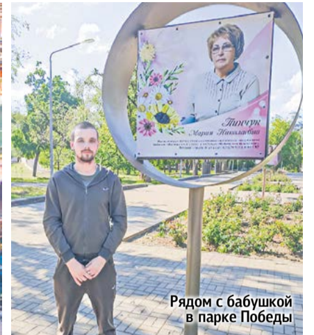
Рядом с бабушкой в парке Победы