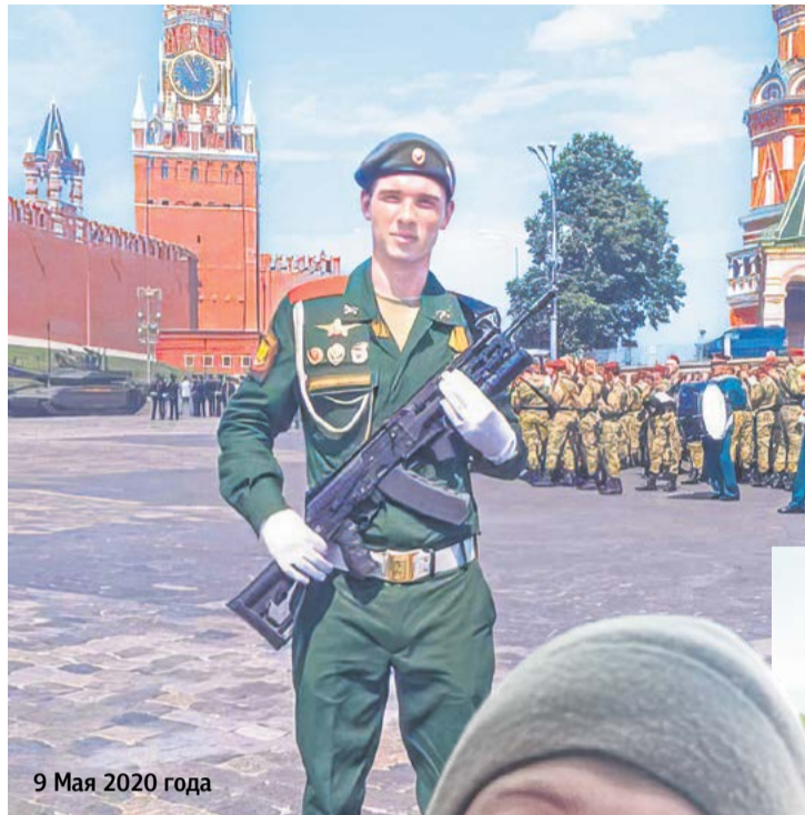
9 Мая 2020 года