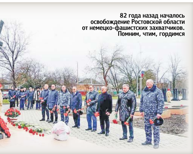
82 года назад началось освобождение Ростовской области от немецко-фашистских захватчиков. Помним, чтим, гордимся

• Монумент строили восемь лет. «Родина-мать» появилась как память о великом сражении, о героизме и стойкости советских солдат.