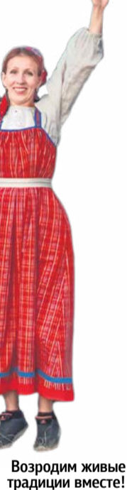
Возродим живые традиции вместе!

Организаторы проведут познавательную беседу-викторину о народной культуре, традициях и костюме. Вовлечут всех желающих в хоровод и традиционные русские забавы, продемонстрируют созданные образы народных костюмов. Желающие смогут запечатлеться в специально организованной фотозоне со старинной создательницей нити – прялкой.