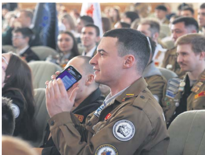
Донские студотряды известны сплоченностью и готовностью трудиться на благо страны и региона

Более тысячи студотрядовцев в этом году будут заняты на предприятиях и в организациях Ростовской области.