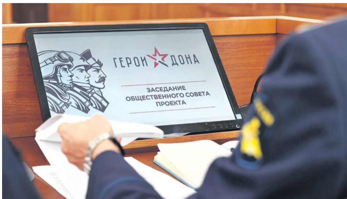
Региональная программа позволит создать в области кадровый резерв для госслужбы из тех, кто уже доказал преданность Родине

– Они лучше многих понимают, что такое защита национальных интересов и безопасность страны.