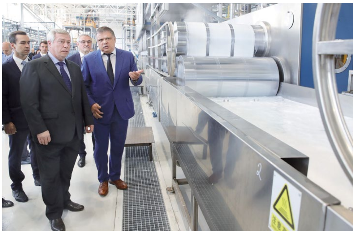
Новые производства – это новые точки развития региона

На предприятиях «Авангарда» трудится более полутора тысяч человек. В мае, напомним, в Шахтах компания запустила современное производство микрофибры – также очень важного материала для всей легкой промыш-