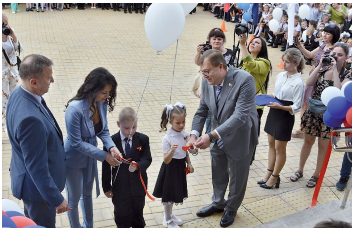
Школьное образование и комфорт бюджетников сейчас требуют особого внимания, считают донские парламентарии

– Мы проанализировали, как менялась в течение последних восьми лет ситуация с финансированием материального обеспечения школ и детских садов, и пришли к выводу, что объем средств, который мы выделяем, отстает от уровня инфляции, – пояснил председатель Законодательного Собрания Ростовской области Александр Ищенко. – Поэтому закладываем в закон жесткую привязку к уровню инфляции, для того чтобы все расходы были обеспечены бюджетным рублем.