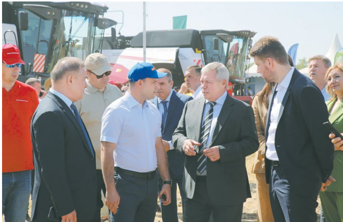
Ростовская область практически готова начать битву за урожай-2023

Самый большой парк сельхозтехники в стране сегодня, как из-