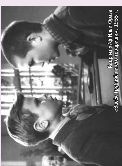
Кадр из х/ф Ильи Фрза «Васёк Трубачёв и его товарищи», 1955 г.

Фраза «кино и немцы» описывает абсурдную, нелепую ситуацию. Это выражение появилось в послевоенные годы, когда советские киностудии стали снимать множество картин о Великой Отечественной войне, в том числе детские – «Васёк Трубачёв и его товарищи», «Улица младшего сына», «Секретарь райкома» и другие.