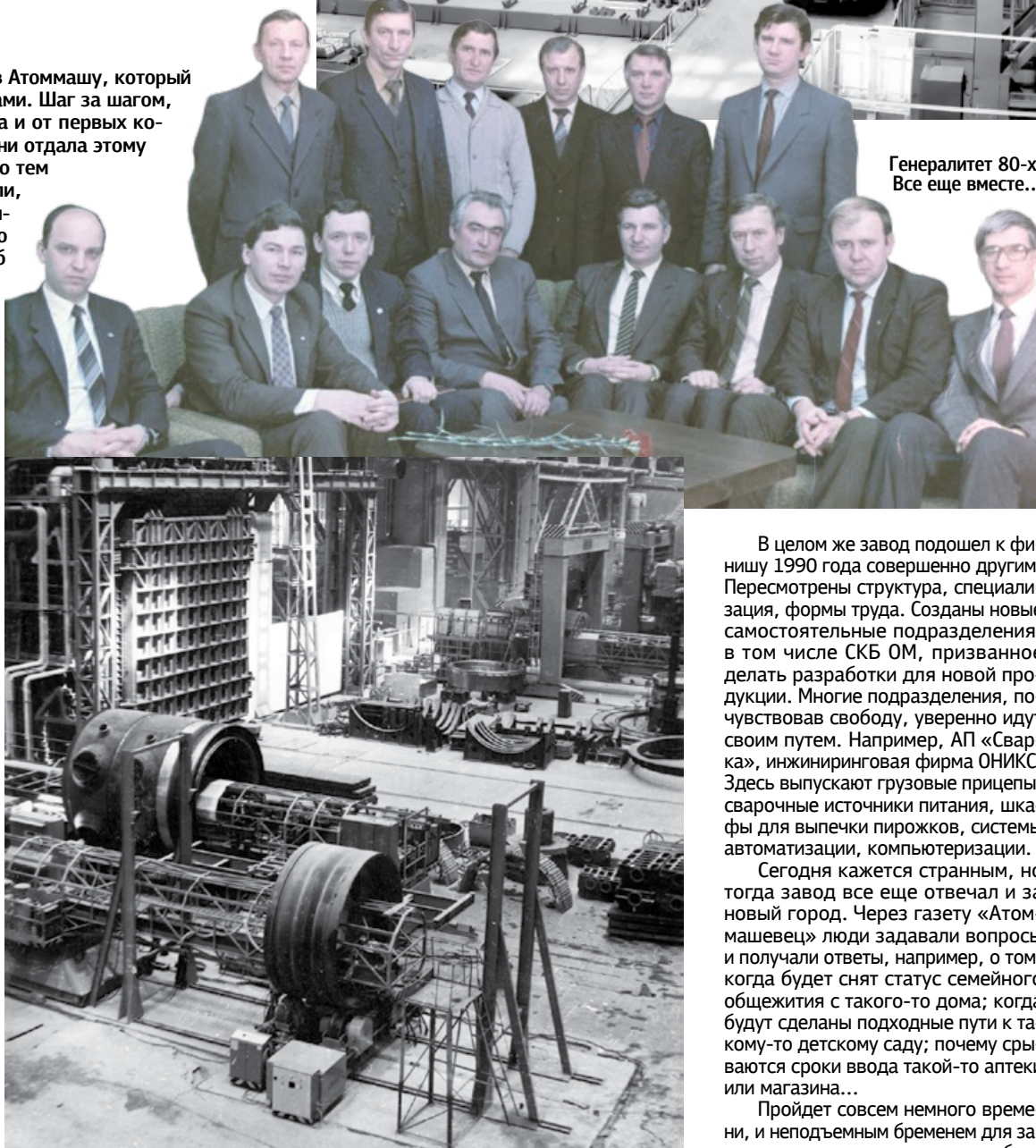
Генералитет 80-х. Все еще вместе...

А вот и «Первые ласточки политической весны». Так мы, окрыленные ветрами перестройки журналисты, называли бурный всплеск политической активности атоммашевцев. На заводе в это время то и дело куда-то кого-то выбирают: в СТК цеха, на пост генерального директора, в народные депутаты СССР. По этому поводу в подразделениях прошло более 100 собраний. В высший орган власти страны цеха и