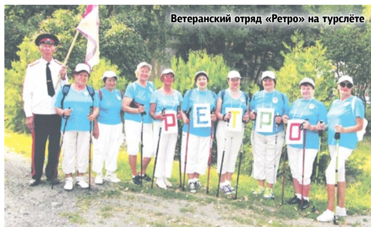
Ветеранский отряд «Ретро» на турслёте