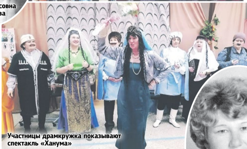
Участницы драмкружка показывают спектакль «Ханума»