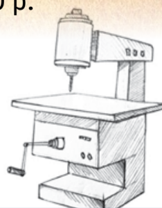
график 5/2, з/п 25000 р.

ул. Гагарина, 68 (зеленые ворота), т. 8-918-540-24-17, 8-951-519-76-43