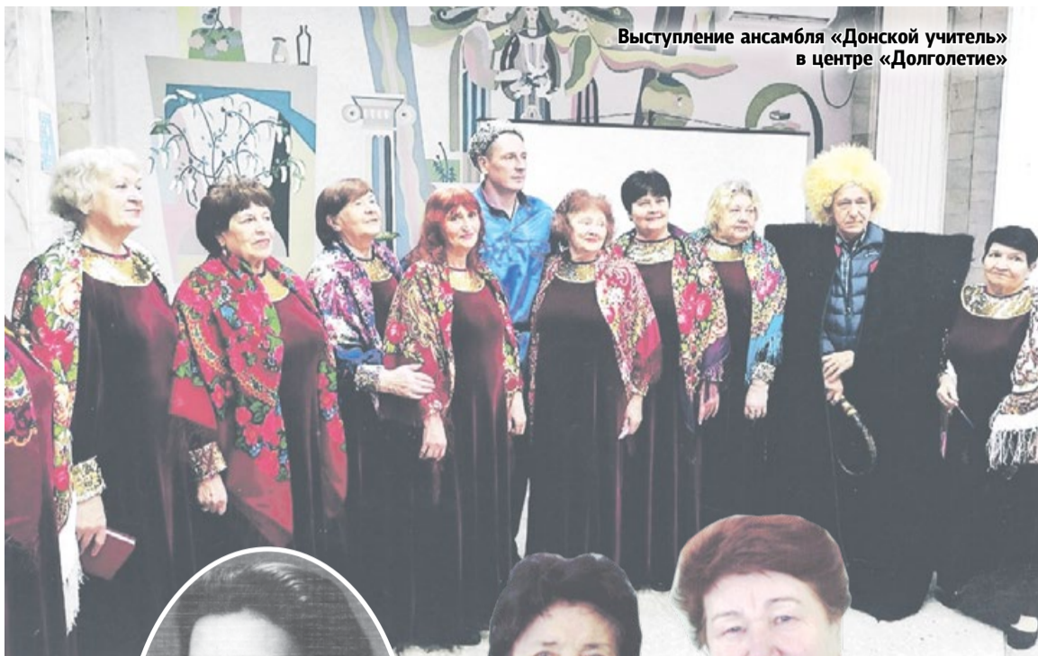
Выступление ансамбля «Донской учитель» в центре «Долголетие»