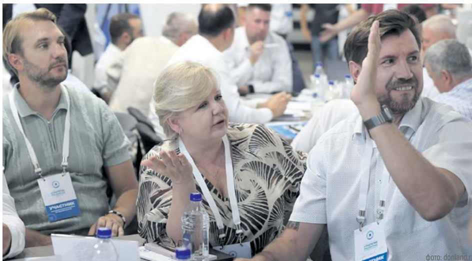
Общая цель участников стратегической сессии – найти решения, которые выведут регион в число технологических лидеров России

«Мы должны чётко понимать, в чём сильная сторона нашей области, в чём сила коллективов, которые здесь работают. Это и есть база для того, чтобы претендовать на лидерство. Все основания у нас есть, нужно просто точнее определить приоритеты и