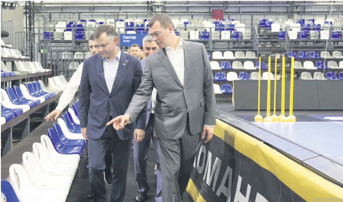
Глава Минспорта РФ Михаил Дегтярев и глава региона Юрий Слюсарь проверили ход работ на спортивных объектах Ростовской области

Министр и глава региона также посетили Ростовское областное училище олимпийского резерва и оценили завершающий этап работ по реконструкции ростовского Дворца спорта. Ремонт в нём проводят впервые с 1967 года, работы идут с опережением графика. Открытие запланировано на сентябрь. Рядом оборудуют