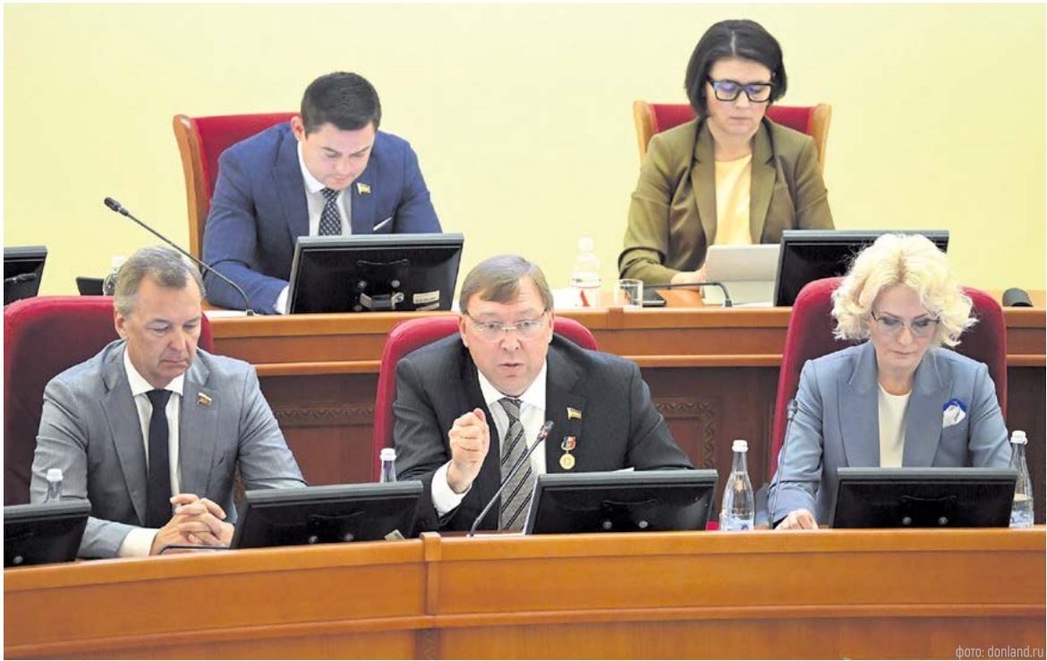
Бюджет Ростовской области всегда формируется и корректируется с учетом потребностей экономики и жителей Дона

годаря новым поправкам получила сфера ЖКХ – 5,8 млрд рублей. Средства направят на капремонт коллектора в г. Таганроге, очистных сооружений канализации в г. Зверево, строительство скважин в Морозовском, Целинском районах, строительство и капитальный ремонт водопроводов в Азовском, Мясниковском, Советском районах и городах Новошахтинске, Ростове-на-Дону.