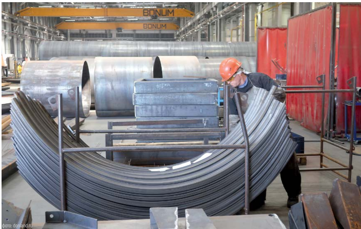
Предприятия Ростовской области с каждым годом расширяют ассортимент экспортных предложений

При этом на Дону идет внедрение Регионального экспортного стандарта 2.0, главная цель которого – закрепить в регионе комплекс мер, позволяющих