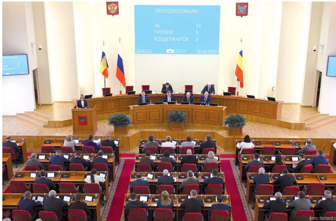
Принятые депутатами поправки – шаги к достижению целей донской «Стратегии-2030»

Как уточнил председатель Законодательного Собрания Ростовской области Александр Ищенко, по