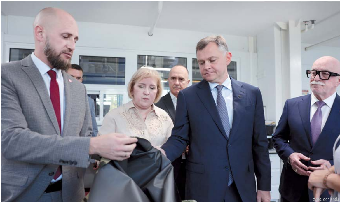
Современные ткани, произведенные на предприятии, позволяют заместить импорт и обеспечить швейные мощности