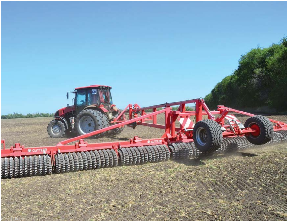
Осенние работы на донских полях идут полным ходом. Сейчас закладывается фундамент урожая-2026

Наполовину завершена и жатва зерновых культур поздних сро-