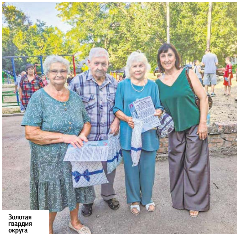
Золотая гвардия округа