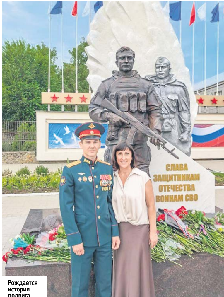
Рождается история подвига