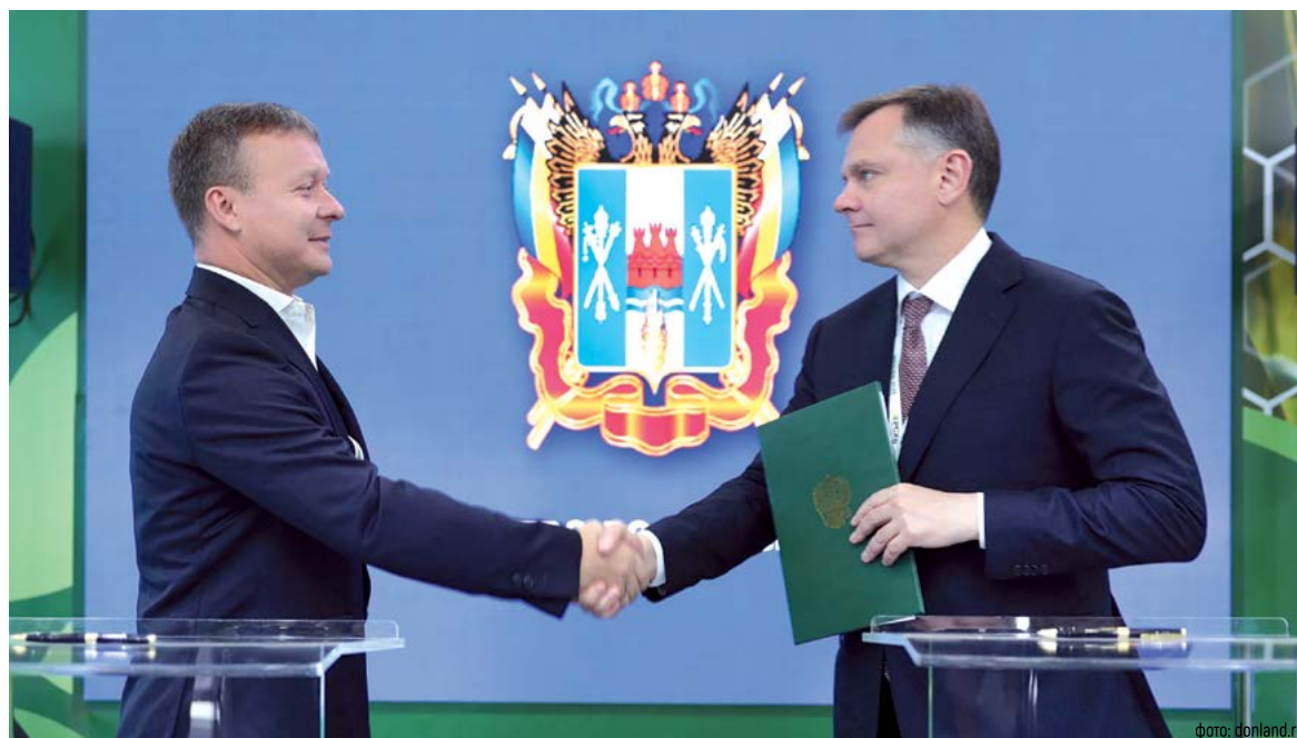
Подписанные соглашения отражают намерение Ростовской области и в дальнейшем развивать сельское хозяйство, а также переработку сельхозпродукции

В настоящий момент компания оформляет земельный участ-