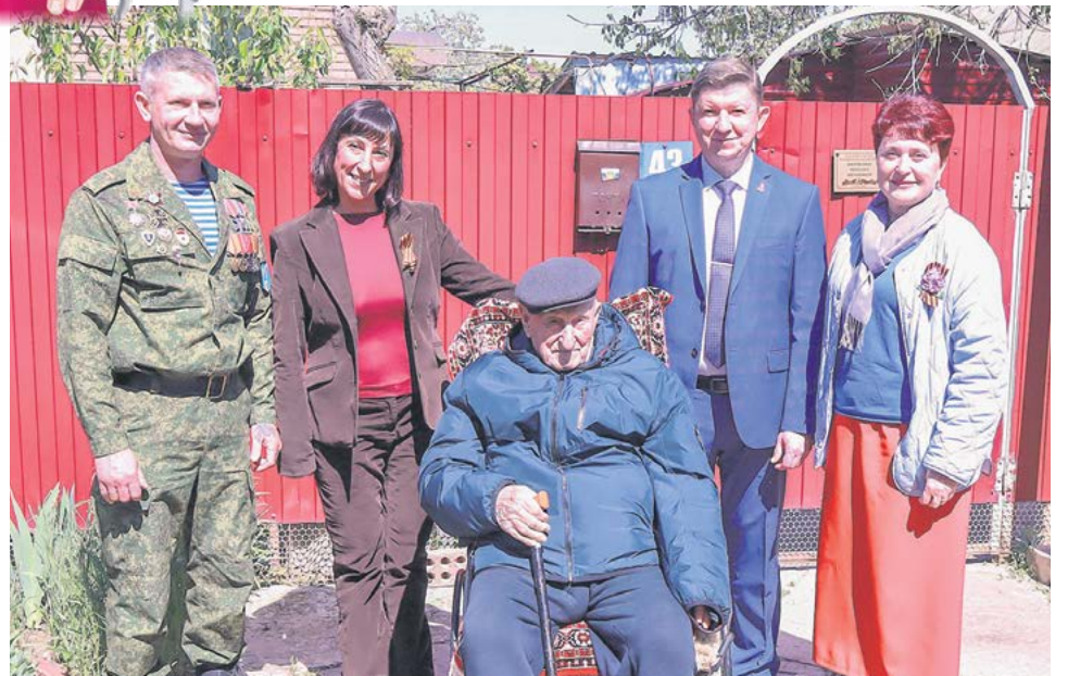
Перед Днем Победы-2025