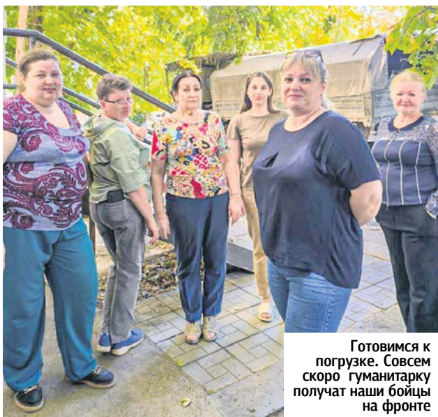
Готовимся к погрузке. Совсем скоро гуманитарку получат наши бойцы на фронте