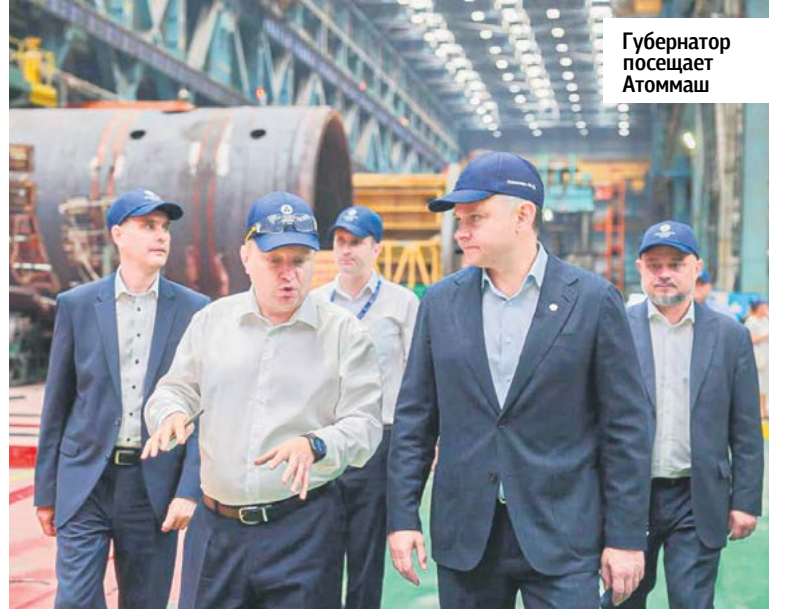
Губернатор посещает Атоммаш