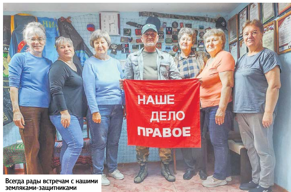
Всегда рады встречам с нашими земляками-защитниками

Одно все знают точно: в каждом пакетике, в каждой коробке, в каждом стежочке, в каждой петельке есть частица душевного тепла и любви каждого добровольного помощника группы «От всей души».