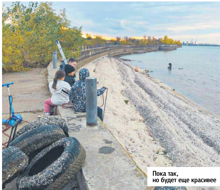
Пока так, но будет еще красивее