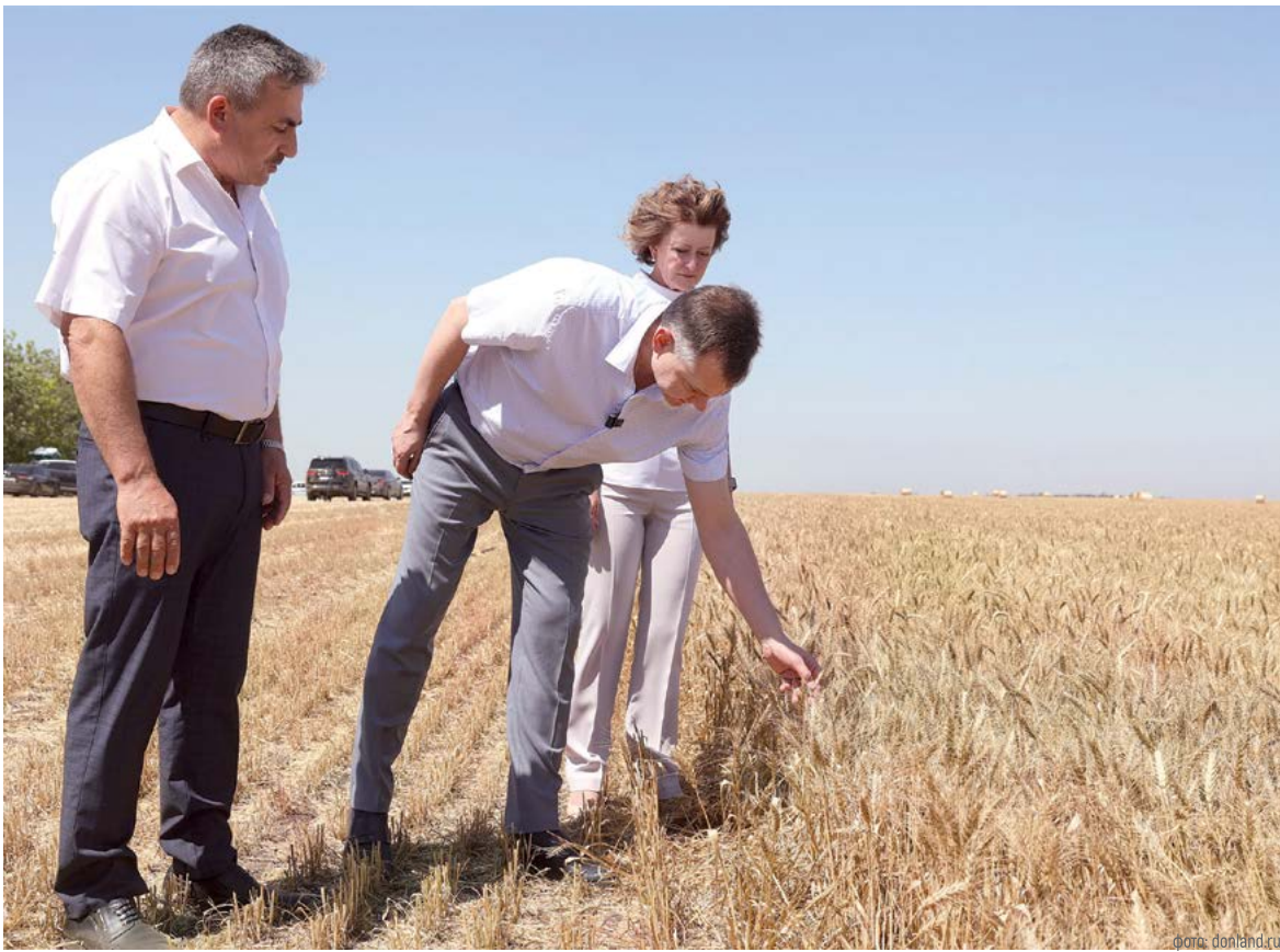
Потенциал АПК огромен, но в меняющихся условиях ему нужна помощь новых технологий

А влага будущему урожаю нужна уже сегодня, поэтому на Дону для обеспечения благоприятных условий созревания зерновых было принято решение впервые применить технологии искусственного вызывания осадков.