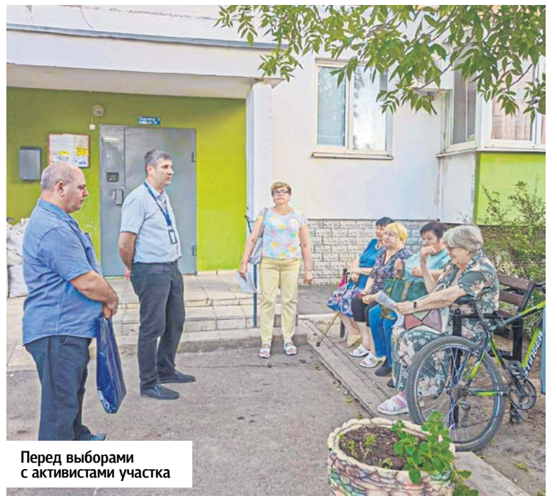
Перед выборами с активистами участка

ство с этой территорией, общение с жителями стало тревожным сигналом к быстрому реагированию. Люки! Масса канализационных люков у школы да и по всему району, кое-как прикрытых хлипкими деревяшками. Разрушенная канализационная магистраль на проспекте Лазоревом. Целый список МКД по сути без дворов, нормальных проездов. Ни одной точки с мало-мальски обустроенной инфраструктурой общего пользования – нет сквера, кафе, библиотеки... Перечислять эти «не» дальше не хочется. Депутат знает каждый проблемный адрес. Это – основа его программы: