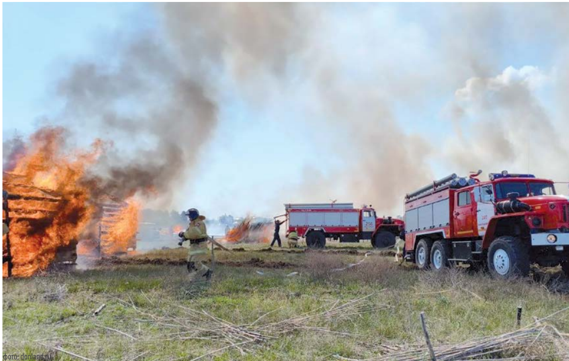
Донские огнеборцы ликвидируют возгорания в нормативные сроки

В лесах Ростовской области пожароопасный сезон был введен в