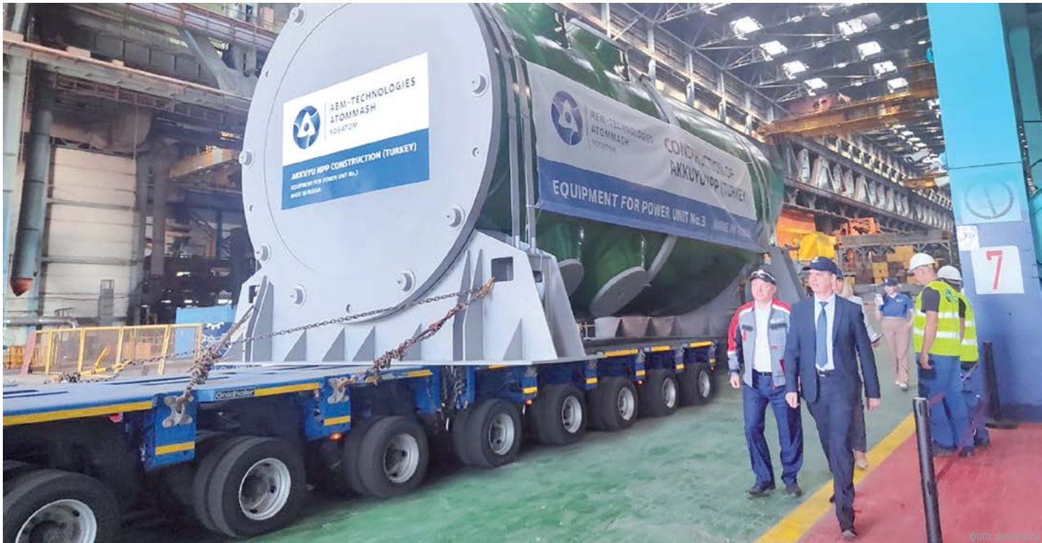
Промышленные предприятия Ростовской области выпускают уникальную продукцию, востребованную как в России, так и далеко за рубежом нашей родины

На завершающем этапе – инвестиционный импортозамещающий проект по расширению производства легкосплавных дисков «Азов-ТЭК», запуск запланирован на 4 квартал 2025 года. «Ростовский трубный завод» на своей дополнительной площадке в Аксайском районе начал выпуск полиэтиленовых труб в тестовом режиме, здесь уже завершены строительно-монтажные работы складского блока, монтаж четырех производственных линий, аккредитована лаборатория. «НЭВЗ» запланировал масштабную модернизацию производства, что позволит увеличить объемы выпуска электровозов, также в планах – разработка новых видов техники.