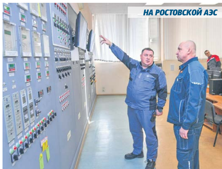
НА РОСТОВСКОЙ АЭС