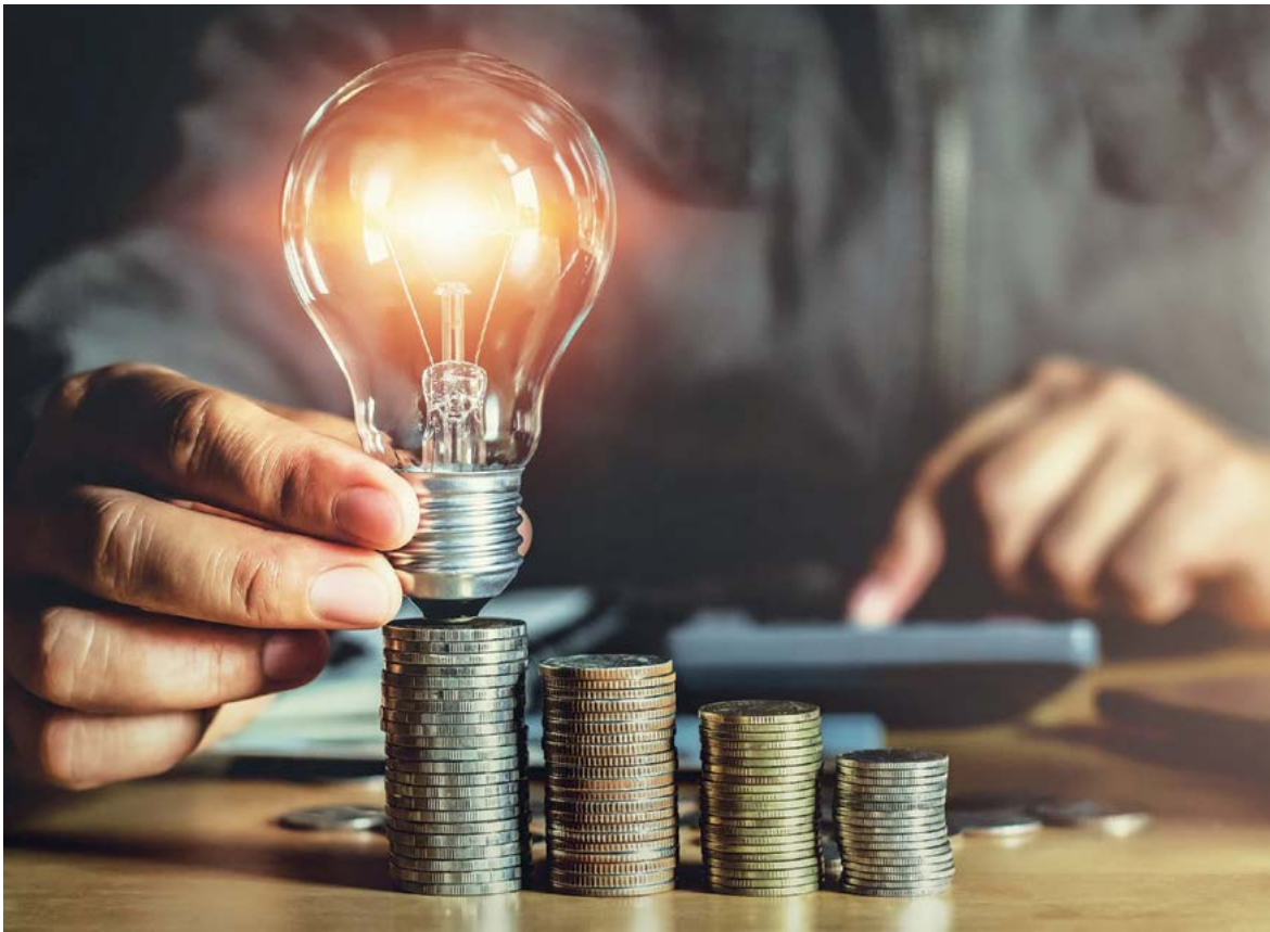
Благодаря новым тарифам некоторые домовладения смогут платить за электричество меньше, чем сейчас