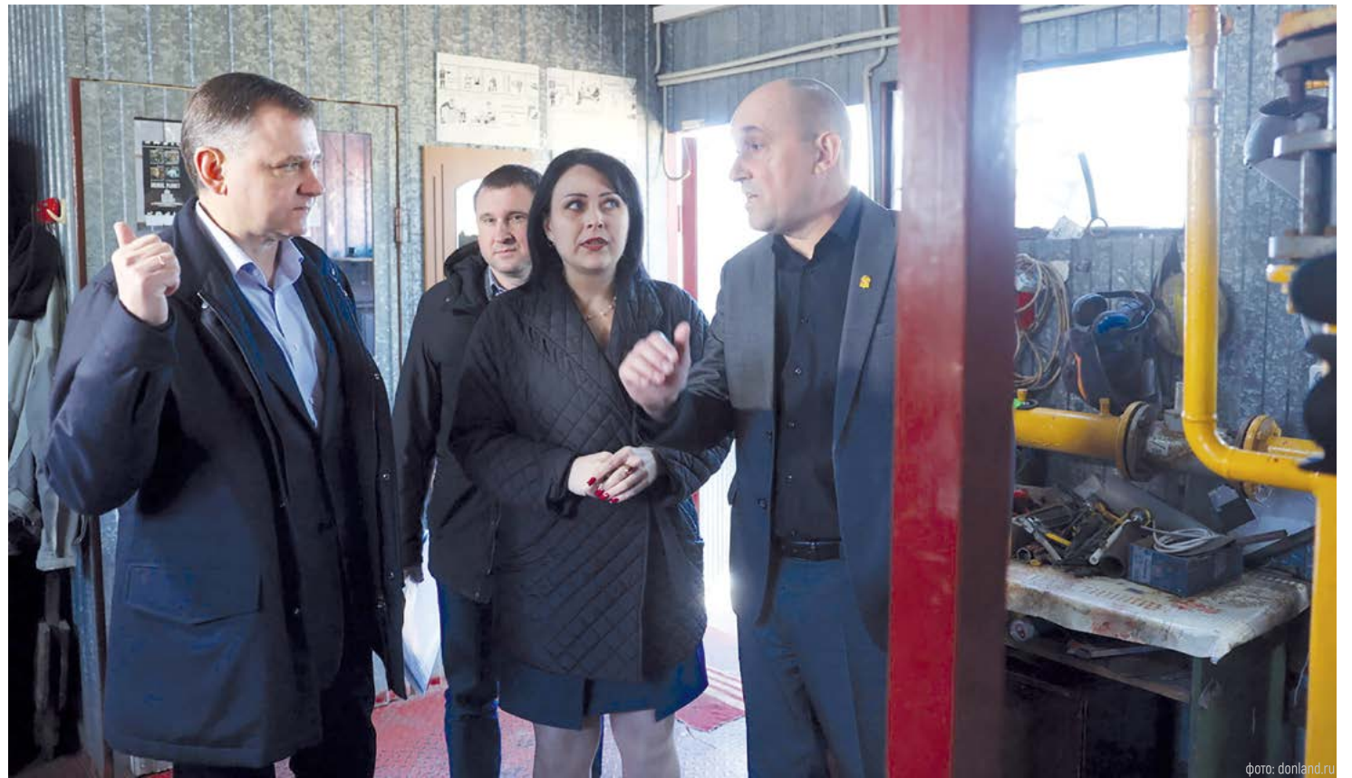
Подходы к оценке деятельности управляющих компаний в Ростовской области изменятся

По мнению главы региона, миллиарды рублей, которые управляющие компании получают от жителей, должны превратиться в качественные услуги. Иначе последуют оргвыводы, предупредил губернатор.