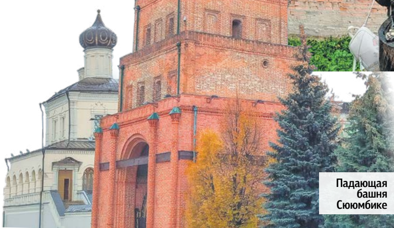
Падающая башня Сююмбике

градские) работают до сих пор. Один из них, оптико-механический, расположен в древнем поселке дровишей на окраине Казани. Сейчас официальное название поселка – Дербышки. Но казанцы говорят только так: