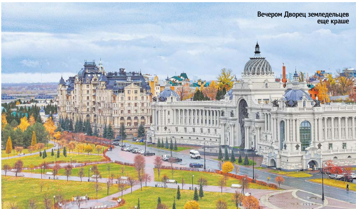
Вечером Дворец земледельцев еще краше