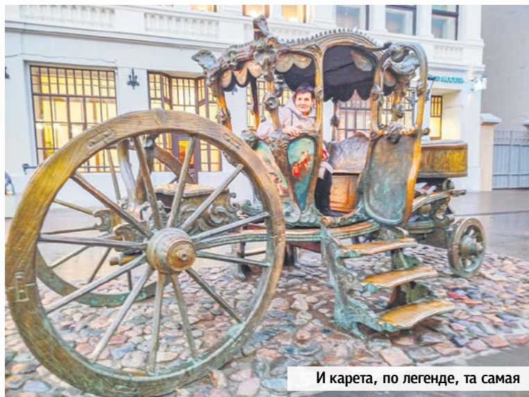
И карета, по легенде, та самая

Бывшая окраинная улица, которую многие жители принимали за начало Сибири, давно стала центром Казани. Сейчас здесь никто не проходит мимо любопытного памятника – кареты Екатерины II (говорят, точно на такой колеснице царица приезжала в Казань в 1767 году). Здесь буквально на каждом шагу – историческое здание или памятник,