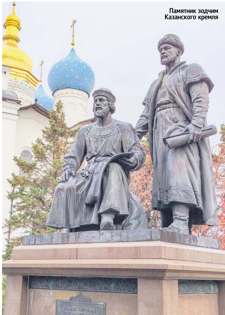
Памятник зодчим Казанского кремля

де. Но! Здесь «всего лишь» остатки Суконной мануфактуры, основанной на заре XVIII века Петром Первым. Ее прелюбопытной истории посвящен целый музей, а я остановлюсь на одном факте. 13 февраля 1873 года у одного из суконщиков – приверженца традиционной русской православной веры (в отличие от большинства живших здесь старообрядцев) родился сын. Отец, горький выпивоха, поучал его: