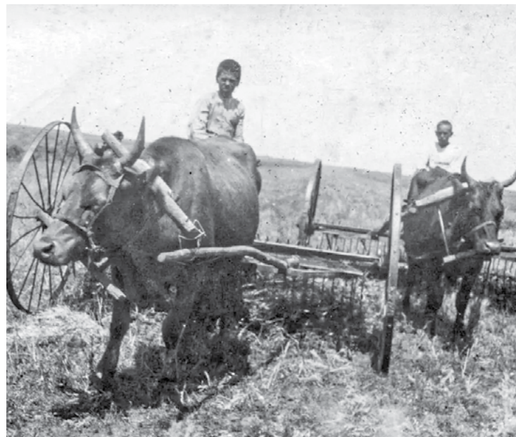
Дети с помощью коров сгребали сено с полей для общественного поголовья