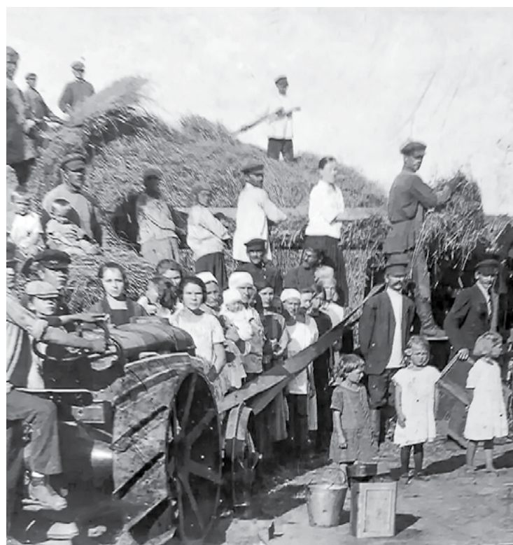
Пшеничные колосья обмолачивали с помощью примитивной молотилки