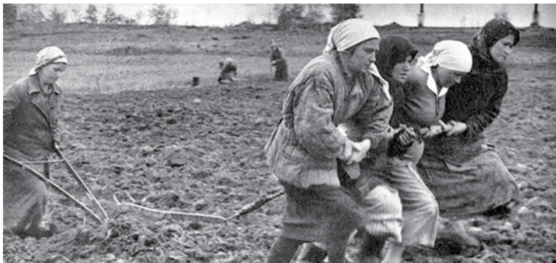
Послевоенное лихолетье в хуторе Антонове. Война уничтожила почти всю совхозную технику и инвентарь. Мужчины все еще были на фронте. Обрабатывать землю пришлось женщинам, старикам и детям на быках, коровах и вот таким бурлацким способом. Но антоновцы выжили