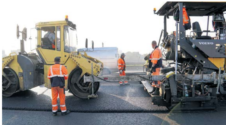
Все дорожные работы будут выполняться под усиленным контролем

По словам главы региона, хорошим подспорьем станет новый нацпроект «Инфраструктура для жизни». На его реализацию в Ростовской области предус-