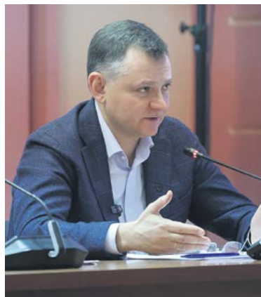
Встреча с жителями района – важнейший пункт программы рабочего визита

Глава региона Юрий Слюсарь посетил Целинский район с рабочим визитом. На месте он изучил проблематику района, обсудив актуальные вопросы и пути их решения на встрече с жителями и представителями администрации.