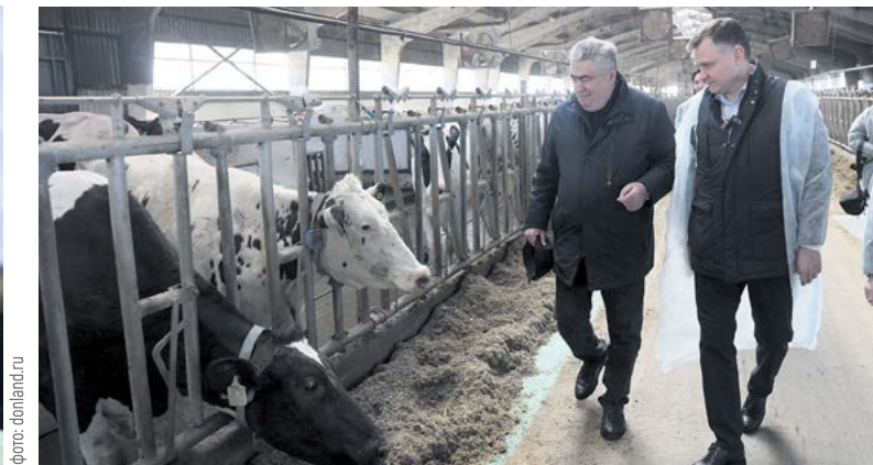
Глава региона ознакомился с работой местного предприятия