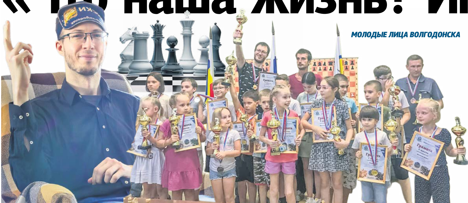
МОЛОДЫЕ ЛИЦА ВОЛГОДОНСКА

Каждый раз при знакомстве с неординарным человеком убеждаешься, что начало движения к успеху начинается с интереса