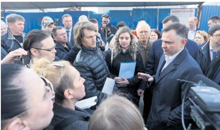
На встречах с главой региона жители поднимают важные для всех вопросы

Чтобы достроить к концу года детский сад на 240 мест, подрядчик ускорит темпы работ – пока сделано около половины от запланированного.