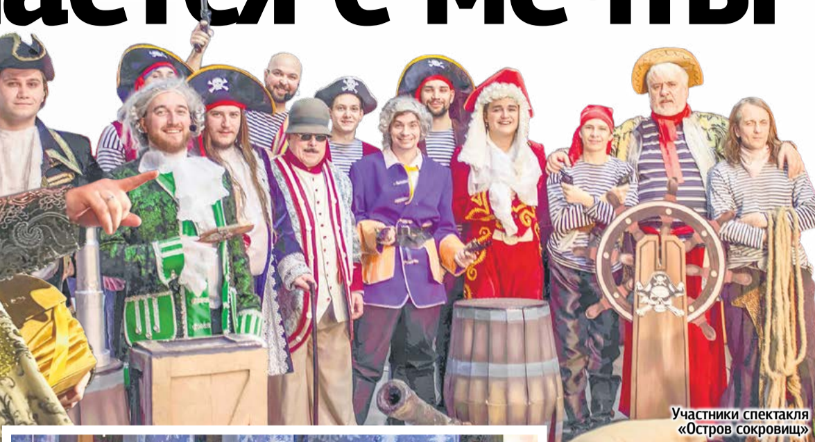
Участники спектакля «Остров сокровищ»