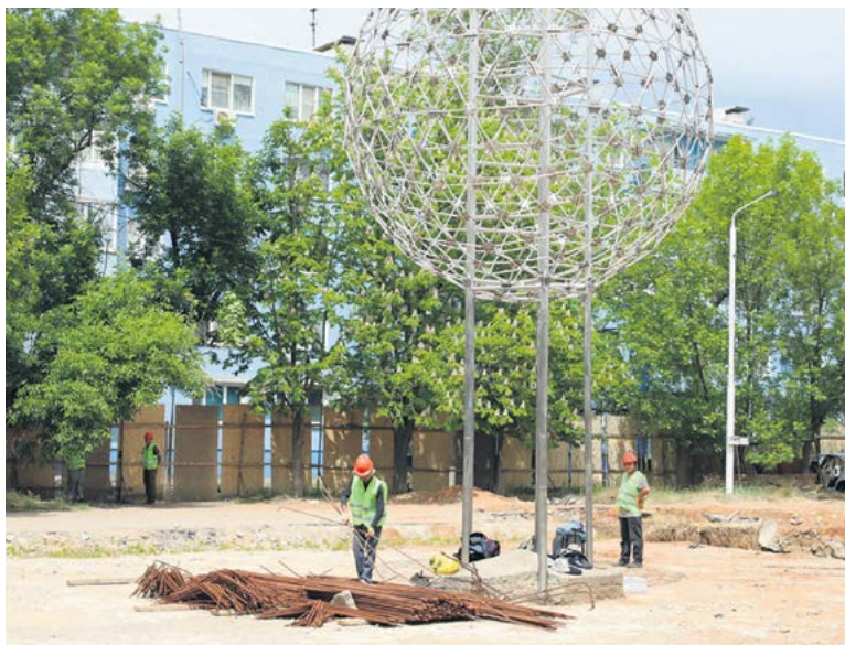
Сквер, любимый волгодонцами, приведут в порядок к концу осени

В Матвеево-Курганском районе начались работы по благоустройству центрального парка рай-