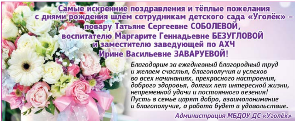
Администрация МБДОУ ДС «Уголёк»