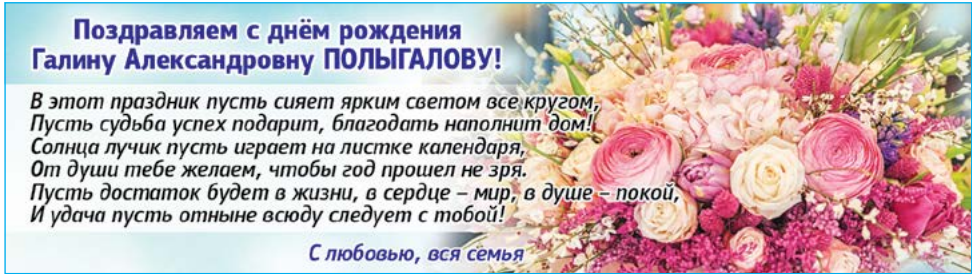
С любовью, вся семья

6.00 - УТРО (12+). 10.00, 17.45 - Время местное (12+). 10.15, 3.55 - Т/с «Чужое гнездо» (12+). 11.50 - Снимаем лапшу (12+). 12.00, 14.00, 16.00, 18.00, 20.30, 23.25, 1.25 - Новости (12+). 12.15 - Т/с «Нераскрытый талант-2» (12+). 13.10, 1.55 - Моя большая семья (12+). 14.15 - Т/с «Чёрные кошки» (16+). 16.15 - Вершки и корешки (12+). 16.45, 2.45 - Магия вкуса (12+). 17.15 - Это Китай! (12+). 18.30 - Тем более (12+). 18.45 - Т/с «Парфюмерша-2» (12+). 21.00 - Праздничный концерт (12+). 23.55 - Х/ф «Государыня и разбойник» (16+). 3.15 - Д/ф «Лучшие самолеты Сухог. Су-27» (12+).