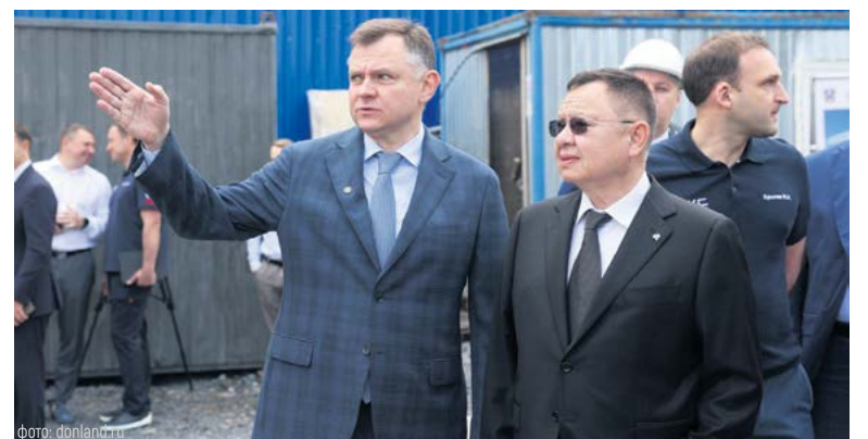
Глава Минстроя РФ уверен, что Западная хорда – проект важный для нескольких регионов

Кольцевая дорога поможет развитию экономики как в Ростовской области, так и в соседних регионах.