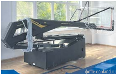
Спортобъекты в Новочеркасске получают новое оборудование