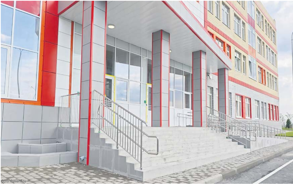
Новая школа в Суворовском уже 1 сентября примет учеников

глава региона подписал распоряжение о выделении недостающей суммы – более 42 миллионов рублей. Деньги предназначены для оснащения спортобъекта и на благоустройство территории вокруг нового ФОКа и обустройство входной группы стадиона.