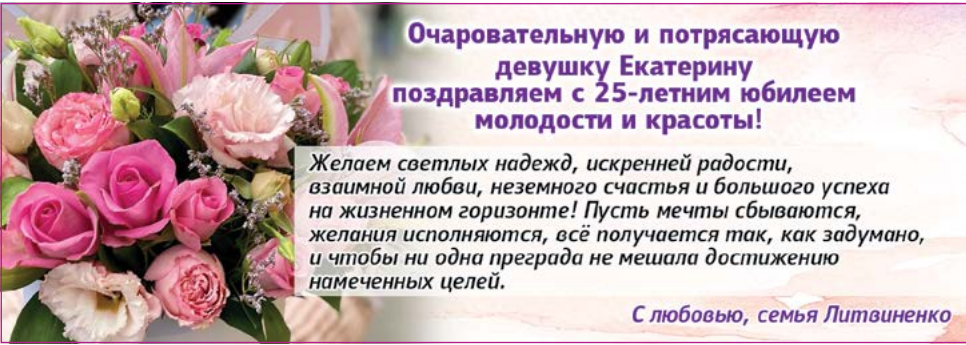
С любовью, семья Литвиненко

6.00 - УТРО (12+). 10.00 - Третий возраст (12+). 10.15, 3.55 - Т/с «Чужое гнездо» (12+). 11.50 - Снимаем лапшу (12+). 12.00, 14.00, 16.00, 18.00, 20.30, 22.45, 0.45 - Новости (12+). 12.15 - Т/с «Нераскрытый талант 2» (12+). 13.10, 1.15 - Моя большая семья (12+). 14.15, 21.00 - Т/с «Чёрные кошки» (16+). 16.05 - Касается каждого! (0+). 16.45, 2.05 - Магия вкуса (12+). 17.15 - Это Китай! (12+). 17.45 - Сугубо личное (12+). 18.30 - Закон и порядок (12+). 18.45 - Х/ф «Смешанные чувства» (16+). 23.15 - Х/ф «Остров везения» (12+). 2.35 - Д/ф «Операция «Березино». Конец игры» (12+). 3.25 - Энциклопедия загадок (12+).