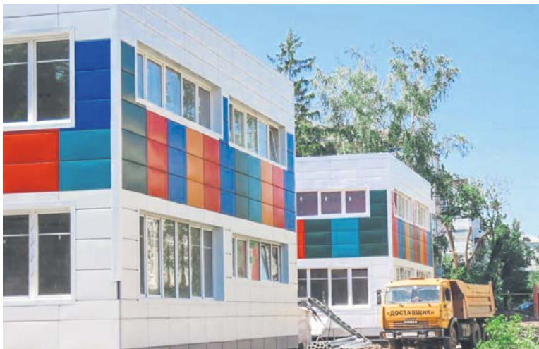
Детский сад «Голубые дорожки» - бывший «Лесовичок»