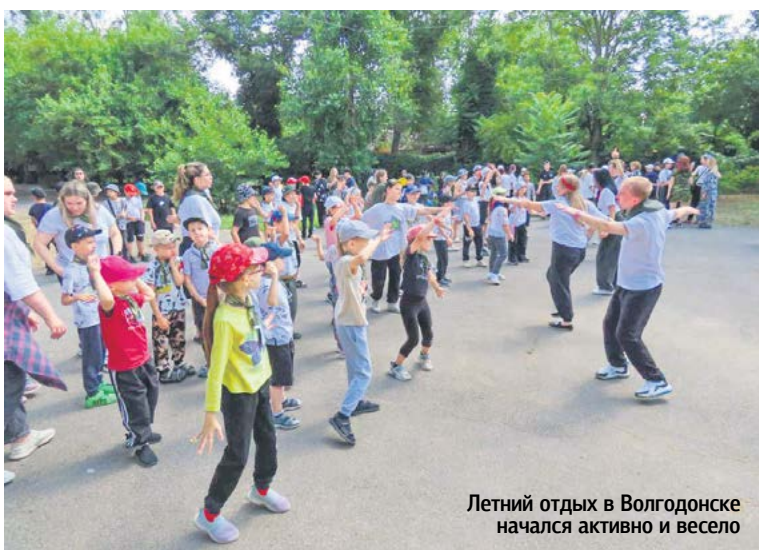
Летний отдых в Волгодонске начался активно и весело