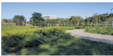
Совместный выпуск правительства Ростовской области и нашей газеты

Глава региона считает, что сегодня, с учетом уже сложившейся городской застройки, не всегда есть возможность создавать новые пространства с озеленением, однако есть современные решения, которые позволяют внедрять рекреационные технологии в городскую среду. Министру, минприроды области и местным властям поручено подготовить предложения по формированию лесопаркового «зеленого пояса» в Большом Ростове.