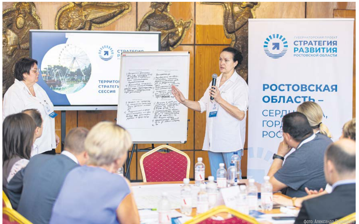
фото: Александр Прохорцев

Лучшие предложения жителей и экспертов найдут отражение в обновленной Стратегии области