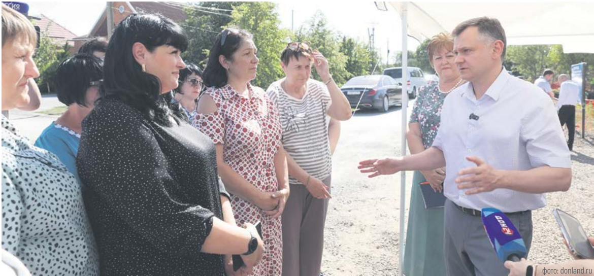
Общение с жителями о том, что уже сделано в районе, и том, что нужно сделать – обязательная часть любой рабочей поездки главы региона

Глава региона проверил, как отремонтировали центральную районную больницу. Капитальный ремонт здания начали еще в 2019 году. Но из-за частой смены подрядчиков закончить работы удалось только в конце прошлого года. После этого по решению Юрия Слюсаря из бюджета области выделили еще более 83 млн рублей. Эти деньги пошли на кислородную систему для хирургии, оснащение лечебного корпуса и благоустройство территории. Сейчас устанавливают медоборудование, а уже с 1 августа примут первых пациентов в терапевтическом отделении, потом от-